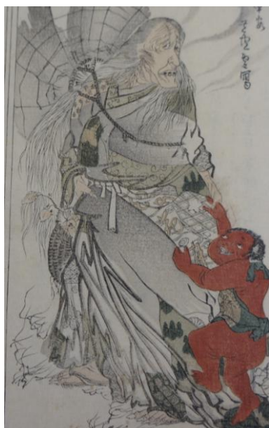
「児持山姥之図」(『嚴島絵馬鑑』巻二)

この企画展示では、『 嚴島絵馬鑑 』に掲載されている絵馬や、現在、宮島の千畳閣に掛けられている絵馬（写真）を紹介します。