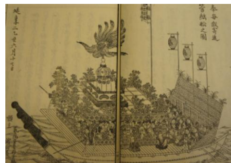
「御管絃船之図」(『嚴島絵馬鑑』巻四)